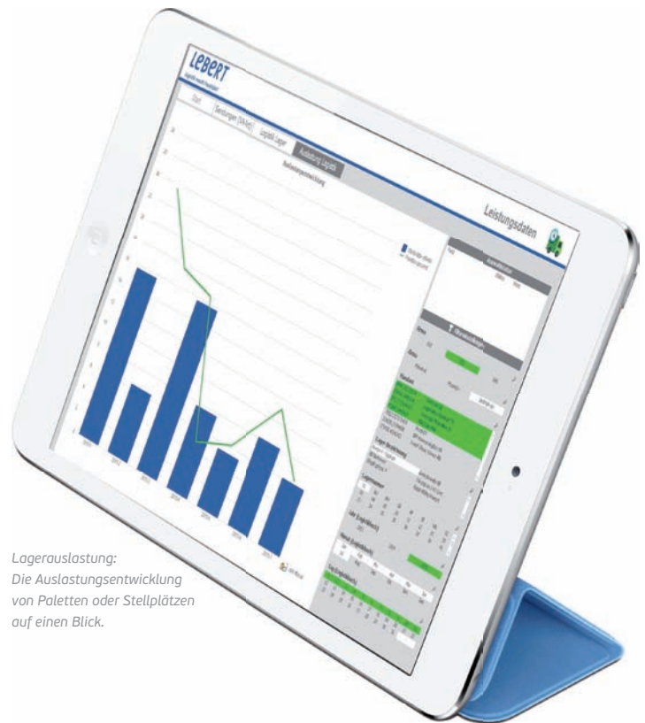
Lagerauslastung: Die Auslastungsentwicklung von Paletten oder Stellplätzen auf einen Blick.