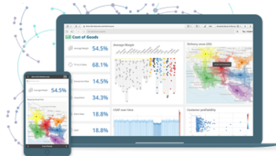
QLIK SENSE REPORTING

Tägliche Datenlieferung an das CRM System für das Marketing - strukturiert und abgestimmt auf die spezifischen Anforderungen der externen Systeme.